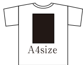
A4サイズ内で表裏指定 (フルカラー、1または2色)

カラー: 基本的に自由。但し金銀、蛍光色は禁止 (フルカラー版/1色または2色版にも展開予定)